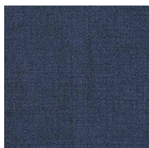
05 Navy Blue